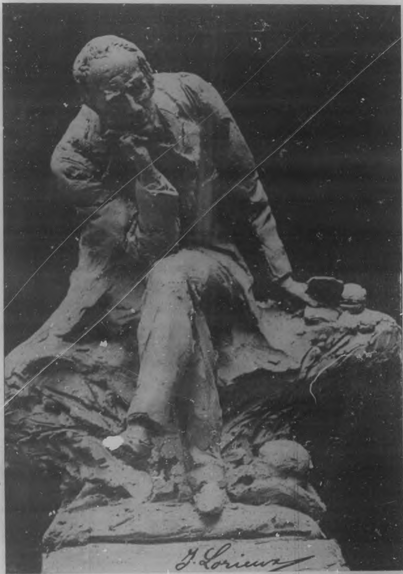
Proyecto del escultor francés Sr. Julián Lorieux