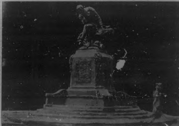
Otra perspectiva del proyecto ó boceto del monumento á Luz Caballero del escultor francés Julián Lorieux. La figura al pie representa al observador para indicar la altura del monumento.

BOHEMIA se complace en ofrecer á sus lectores estas notas rebosantes de patriotismo, y de recuerdo á uno de los más grades hombres de nuestra tierra.