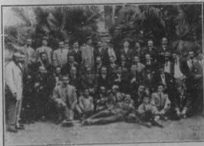
Grupo de concurrentes al almuerzo con que fué obsequiado el pintor Luis Graner, en "La Tropical" el pasado domingo.

Nos es grato en grado sumo publicar en nuestras páginas