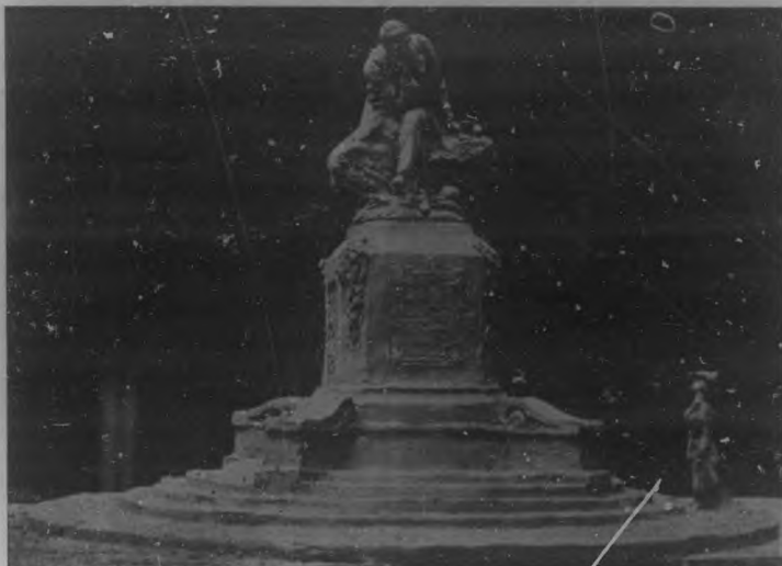
Vista de frente del proyecto ó boceto del monumento á Luz Caballero del escultor francés Julián Lorieux. La figura al pie representa al observador para indicar la altura del monumento.