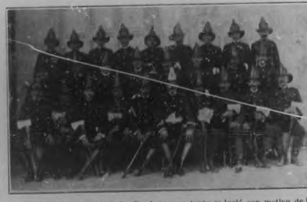
Fotografía de la Escuadra de los Bomberos que tanto se lució con motivo de las fiestas de los Desamparados.

Algunos de los cuadros que exhibe el señor Hermoso, adolecen de pequeños detalles de dibujo, pero en cuanto al colorido no se le puede pedir más, lo que nos hace alentar